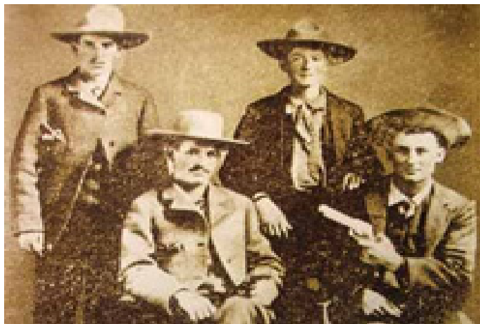
Enige bekende geauthenticeerde foto van Sam Bass. LR: Sam Bass, Joe Collins, John E. Gardner, Joel Collins.